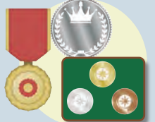
勲章・金貨 貨幣セット