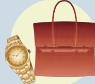
ブランド品・時計