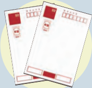
未投函ハガキ 年賀状・書き損じ等