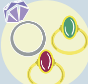
ダイヤモンド・宝石