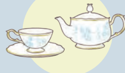
ブランド食器 ※マイセン/ウェッジウッド/パカラ等