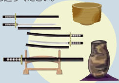
骨董品・刀剣・刀装具