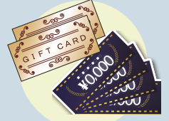
図書券・クオカード・金券 ※有効期限が3か月以上あるもの